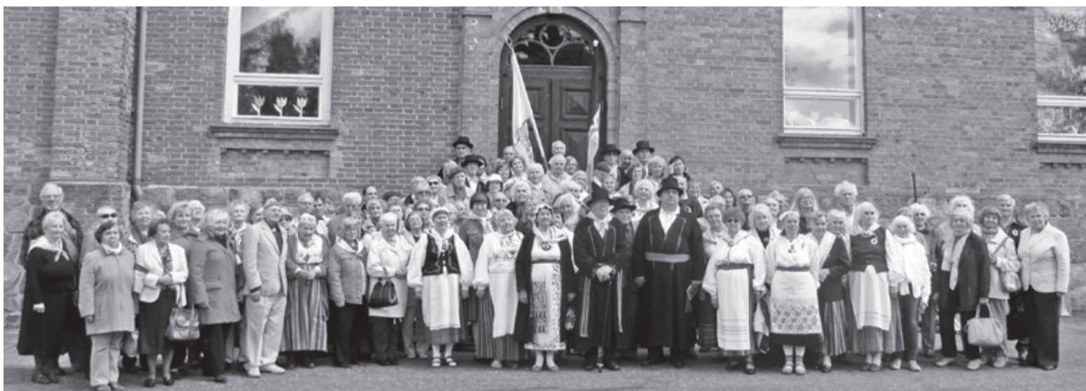
Mulke Seltsi liikme ja nende sõbra 24. mail Ummuli mõisa ihen.

Pääle kuunolekut sõitsime bussege Tõrvast Ummulise ja sääl