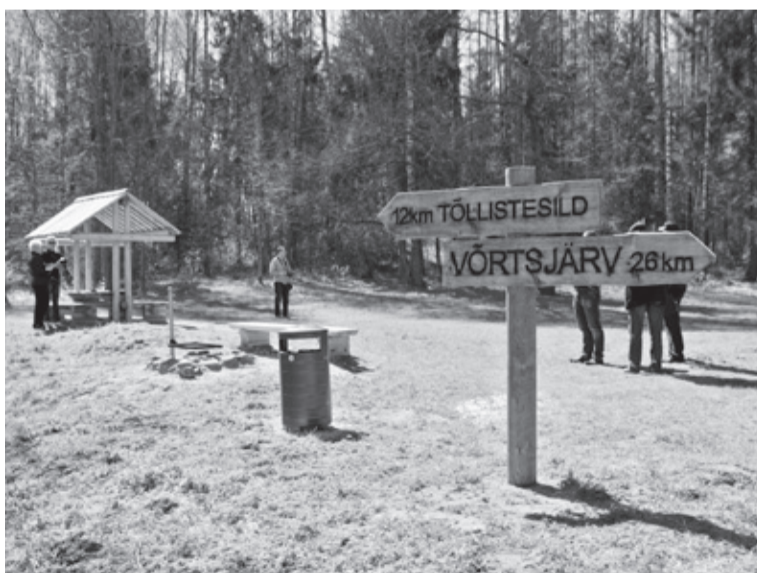
Ummuli puhkeala om nüid kõrran ja oodap suvitejit.

Sii om miu latsepõlvema. Pääle sõda käesi ma emäge üteli, temä käis siin jõe luha pääl taluperimihel aina niitman. Sõda olli just lõppenu. Aenamäa pääl olli lõhkenu ja ilma lõhkemede mürske, esiki soldatide laipu olli. Kooliaal lasksemi mäest alla liugu ja käesimi jääminekut kaeman. Nägimi kah palgiparvetemist. Mitu kõrda ole ma latsepõlven siin ka kalal käenu. Tollel aal ollive jõe perve järsu ja võsan. Ka üle jõe ole ma siit käenu. Latsepõlven käesimi vanembide inimstege parvege üle jõe ja lätsimi Unikülä mõtsa mustikile. Talve ole ma mitu kõrda suuskege üle jõe Rumba ruusaaogun käenu. Üts poiss oma sõsarege käis lootsikuge üle jõe Ummuli koolin. Poiss olli üttsahe viil miu penginaaber. Latse tullive Uniküläst. Lootsik