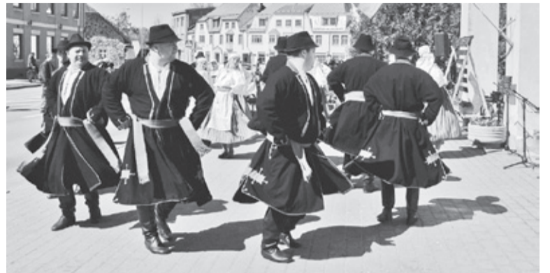
Elme kihelkonnapäeväle ollive tantsma tullu kah Tarvastu mulgi.

Mulgi meistre õpassive vilespilli tegeme ja näpunüüri põimma. Mulgipada olli aga siande