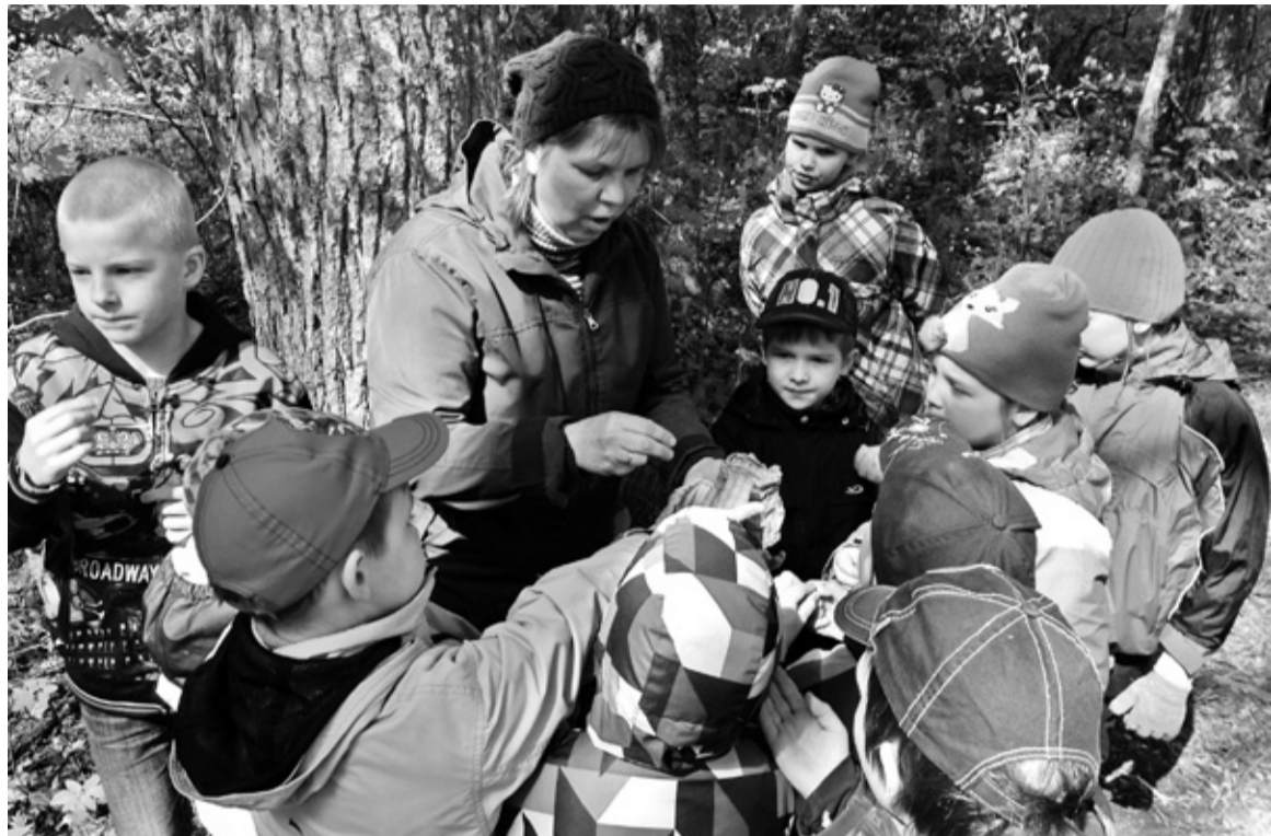
Ly edimese lassi lastege mõtsan kadajamarju mekman.

poodi man käimä, maja ümmer kasvap pallu ääd söögiraami. Ja ku looma laudan, sis nälga ei jää. Ilma interneti, telefoni ja elektrede ei jää elu seisma. Tua saave soojas puudege, vett saap kajust või allikust, käimla jaos ei ole kah puhast vett vaja raiasate. Ja kui raasike aiga repi pääl istu, sis joosep silme ehen peris luudusvilm. Miu mõte om sii, et kigile ei piagi luudus ja maaelu irmsaste miildime. Pääasi, kui inimene lihtsalt ennest sääl äste tunnes – ei pelgäs unti, puuki ja putukit. Ja kui na suures kasvave ja üitskik, mis ammati pääl om, sis mõistas õigist otsussit vastu võtta, ku asi putup maaelus.