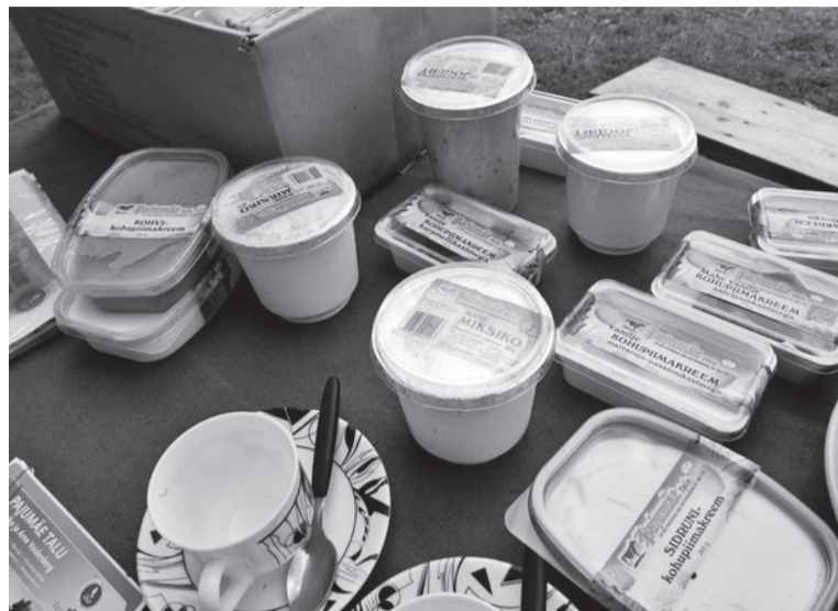
Pajumäe kaup om üle Eesti kuulsas saanu ja sedä müvväs palluden puuten.

Küsimise pääle, mesperäst osta just Pajumäe kaupa, vastap peremiis sedäviisi: „Mede kaup om kindel ja kik üte kotusse pääl otsast lõpuni valmis tettu. Sii süük om puhas ja ää maiguge. Muduki om kah neid, kes tervise