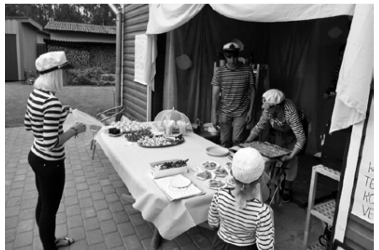
Kalakohvikun pererahvas olli kik meremiherõövin.

Kohvikupäev tõi Tõrva ulka rahvast nii Mulgimaalt kui pallu kaugembelt. Tõrvakil endil olli kah ää miil, et olli põhjus kodust