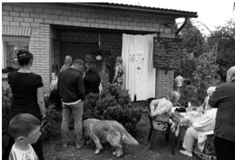
Kohvikun Vanaema Juures tundsive ennest äste nii suure inimese, latse ku looma – nagu vanaemä man piapki oleme.

Söögi ja joogi kõrva võis mitmen kohvikun kah elävet muusikat kullete. Kolme Karu jahikohvikun sai peris jahimihege jahijuttu aade, püssi ja ülge